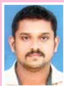
സുനിലാൽ. എസ്. എൽ.